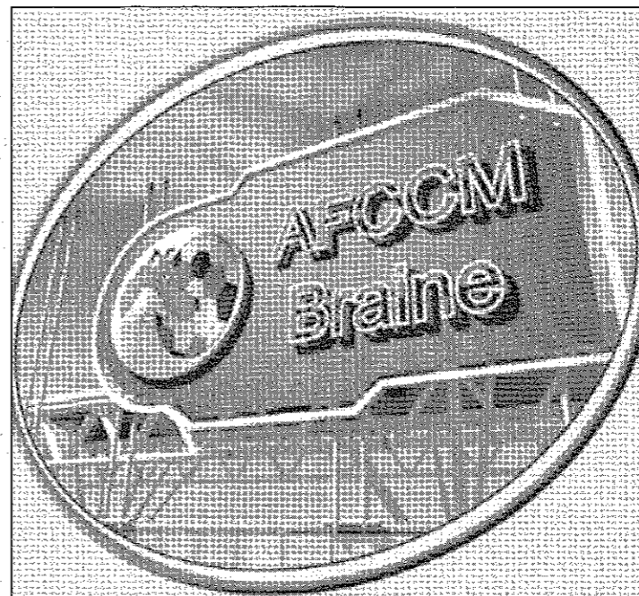
Un portail qui pourrait donner l'impression de se retrouver sur le site d'un club de D1...

reçois même des mails de joueurs africains qui se proposent à passer des tests chez nous, ils pensent qu'on est un club de D1 belge... »